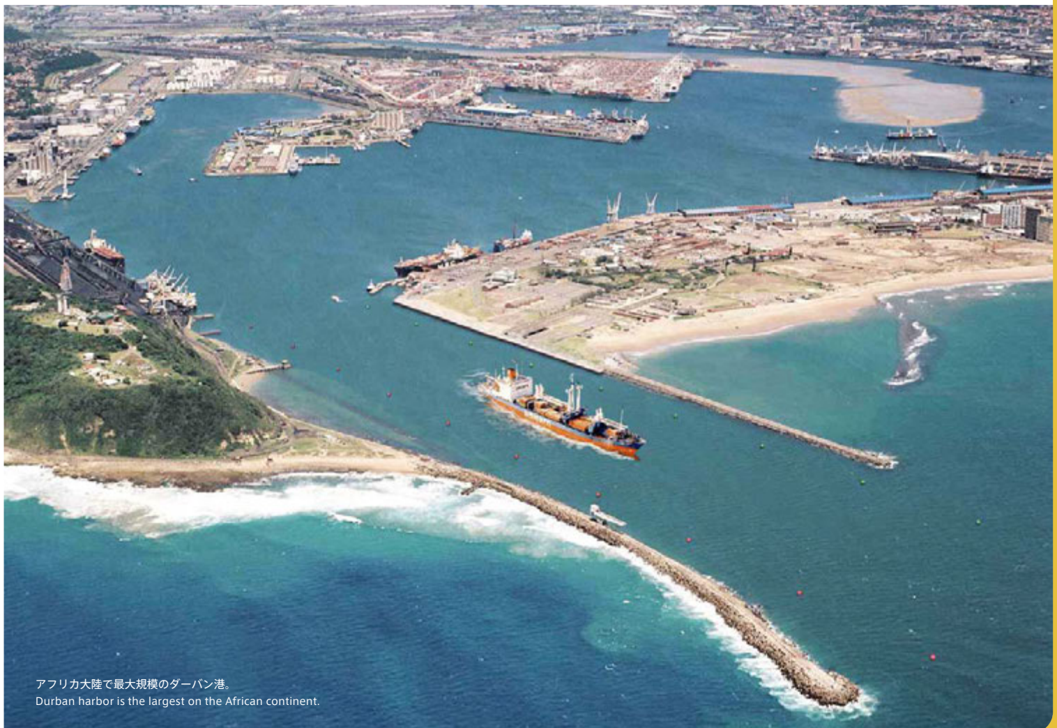
アフリカ大陸で最大規模のダーバン港。 Durban harbor is the largest on the African continent.

The Dube TradePort Project foresees 25 million travelers using King Shaka International Airport by 2060. Although it might seem quite bold at the present time, Erskine says that if they are to continue building a port city that will last for fifty or sixty years, they cannot employ simple tricks or patchwork measures, and must develop everything, even if it involves the entire city. ㊦