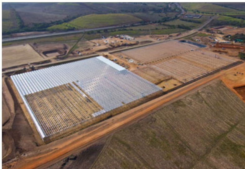
アグリゾーンでは、オランダ企業とのグリーンハウス設置をはじめ大規模な農園開発が進む。 The Agri-Zone is seeing large-scale farm development, including the installations of greenhouses in cooperation with a Dutch company.

開発の第一段階としてオープンしたキング・シャカ国際空港。その規模は「今後は、国内やアフリカ近隣だけでなく、ヨーロッパや中東、アジアからの観光客誘致を積極的に展開し、エアバスA380といった超大型旅客機の乗り入れも視野に入れている」とデューベ・トレードポートの